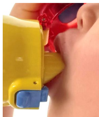
飲み口をくわえる飲み方

水筒を持って外出することも多くなる季節ですね。ふだん、お子さんはどのように水筒(ペットボトル)を飲んでますか？大人のように上手に飲めない子どもは、飲み口をくわえるように飲んだ場合、口の中の食べカスや雑菌が水筒内へ入ることがあります。まだ上手に飲めない間は、コップへ注ぐ方法で対応できると水筒内をきれいに保つことができます。